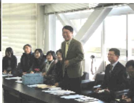
<教育委員会での話し合い>

視察団の先生方は、鹿嶋市教育委員会にも行き、日本と韓国の教育事情について、話し合いました。