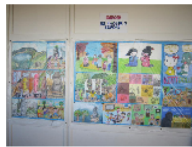
<ドンホン小学校からいただいた習字や絵>