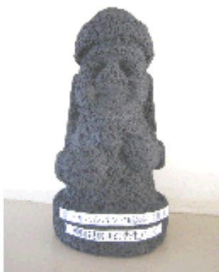
<お土産でいただいたトルハルバン> (チェジュ島のシンボルです。)