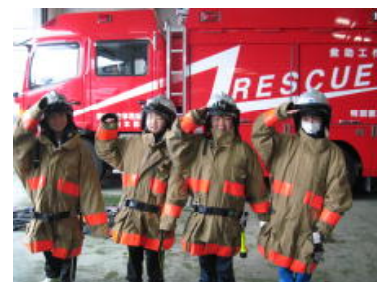
消防署を見学してきました。