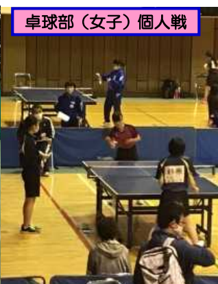
卓球部(女子) 個人戦