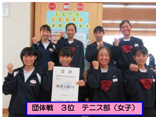
団体戦 3位 テニス部(女子)

先週の10月27日(火)のテニス部(女子)の個人戦から、玉造中の新人戦の県大会がスタートし、30日(金)のハンドボール部(男子・女子)で終了しました。県大会に出場した各部活の皆さん、お疲れ様でした。県のレベルはどうでしたか? 県東地区よりもさらに高いレベルを肌で感じることができたことは、とても貴重な経験になったと思います。県で勝つために、これから何をすればよいのか? 自分たちに足りないところは何なのか? を考えながら、これからの練習を頑張っていて欲しいと思います。そんな高いレベルでも4位に入賞して賞状をもらってきたテニス部(女子)の皆さん、おめでとうございます。来年の総体ではさらに上の大会である関東大会や全国大会を目指して欲しいと思っています。ファイト!! 玉中2年生!!