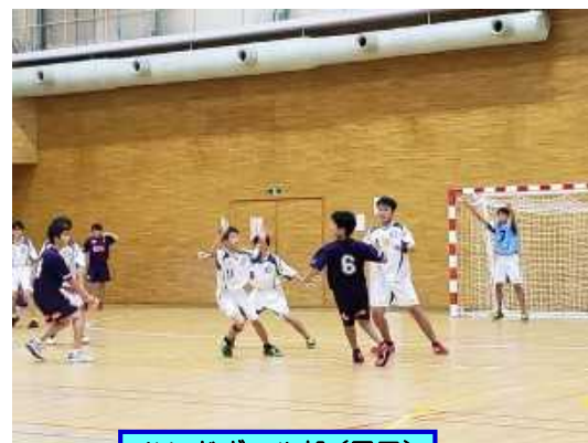
ハンドボール部(男子)