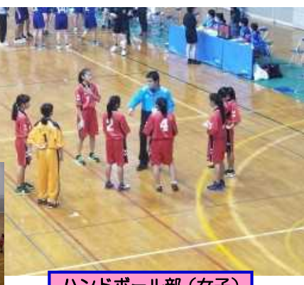
ハンドボール部(女子)