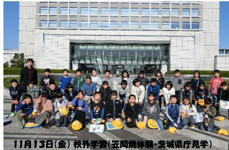
11月13日(金) 校外学習(笠間焼体験・茨城県庁見学)