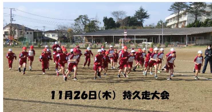
11月26日(木) 持久走大会