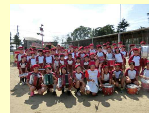
←運動会での鼓笛隊