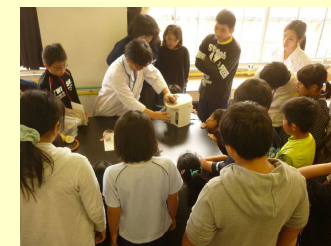
心臓マッサージの訓練→