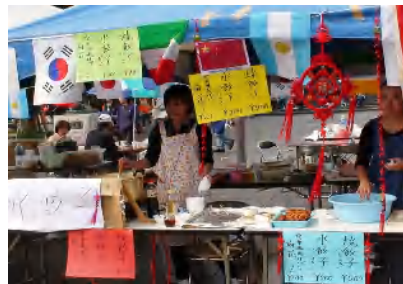
▲中国料理・水餃子、他