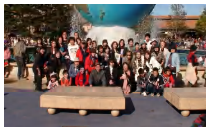
▲2号車に乗車の皆さん