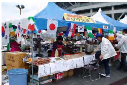
▲韓国料理・チヂミ、他