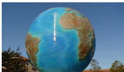
▲東京デズニーシーのシンボル