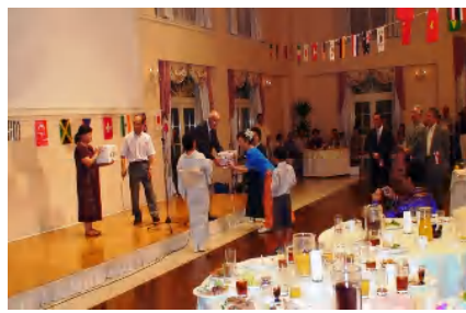
▲ お楽しみ抽選会の様子－1と－2▲