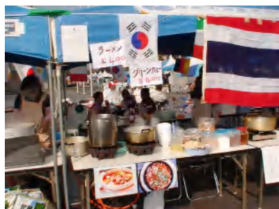
▲タイ・タイラーメン、他