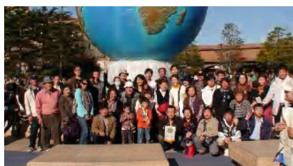
▲1号車に乗車の皆さん