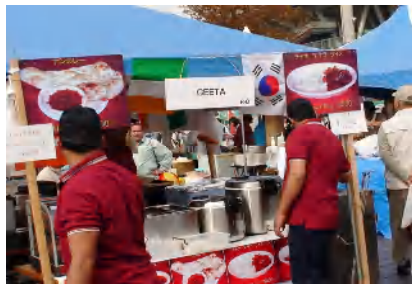
▲インド料理・インドカレー、他