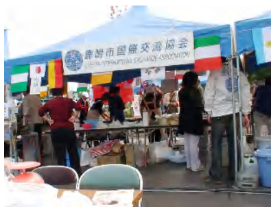
▲鹿嶋市国際交流協会