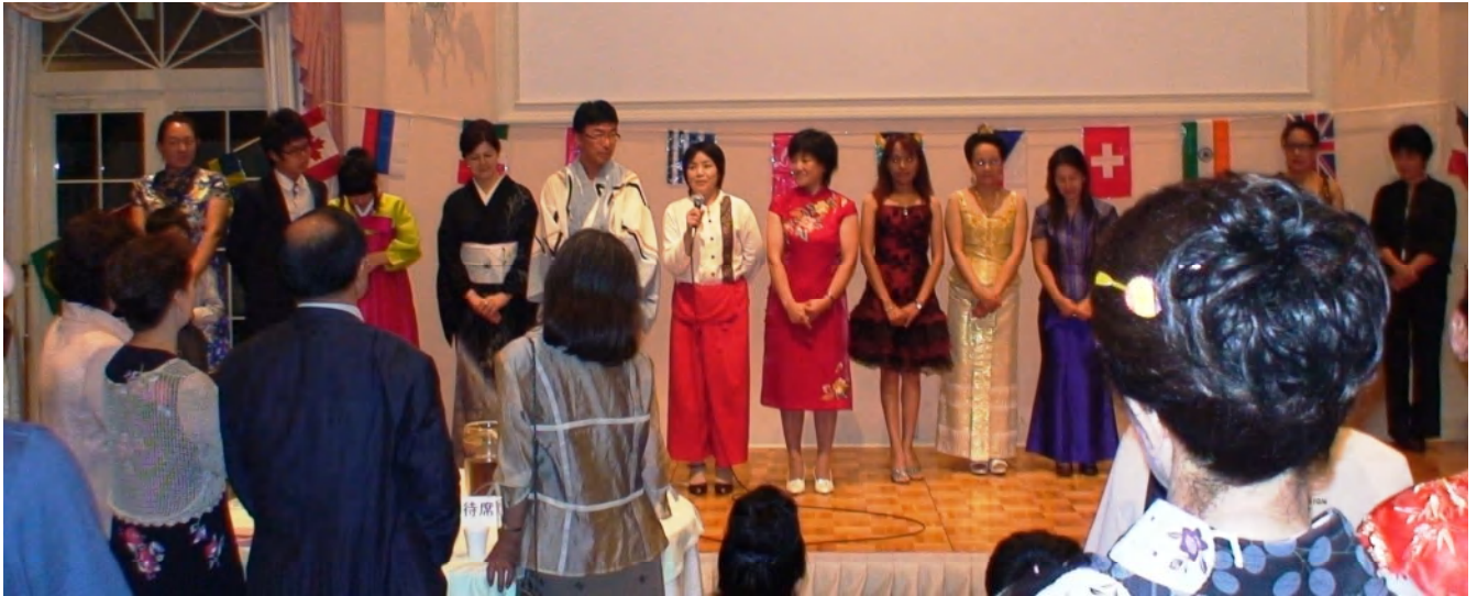
▲世界の民族衣装の紹介の様子

2009年7月26日(日) 国際交流パーティ 於:アジュール鹿嶋ウエディングハウス