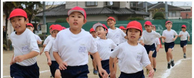
〈1年生の持久走大会の様子〉

12月に入り、校内でもインフルエンザが流行しております。学校では、手洗い・換気・消毒の徹底を継続しておりますが、ご家庭におかれましても、登校前の検温や十分な睡眠、丁寧な手洗いなど、改めてお声がけいただくようお願いいたします。