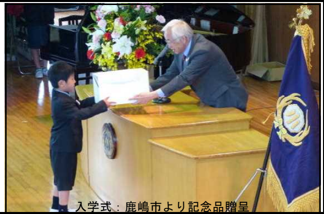
入学式：鹿嶋市より記念品贈呈