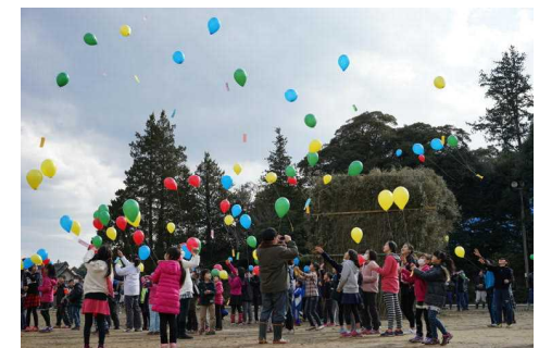
（どんど小屋と風船飛ばし）