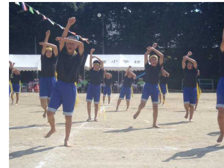
（4～6年生による要ソーラン）