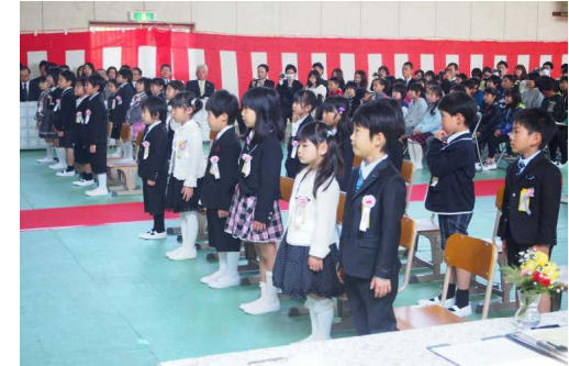
（式場に入場した新入生）