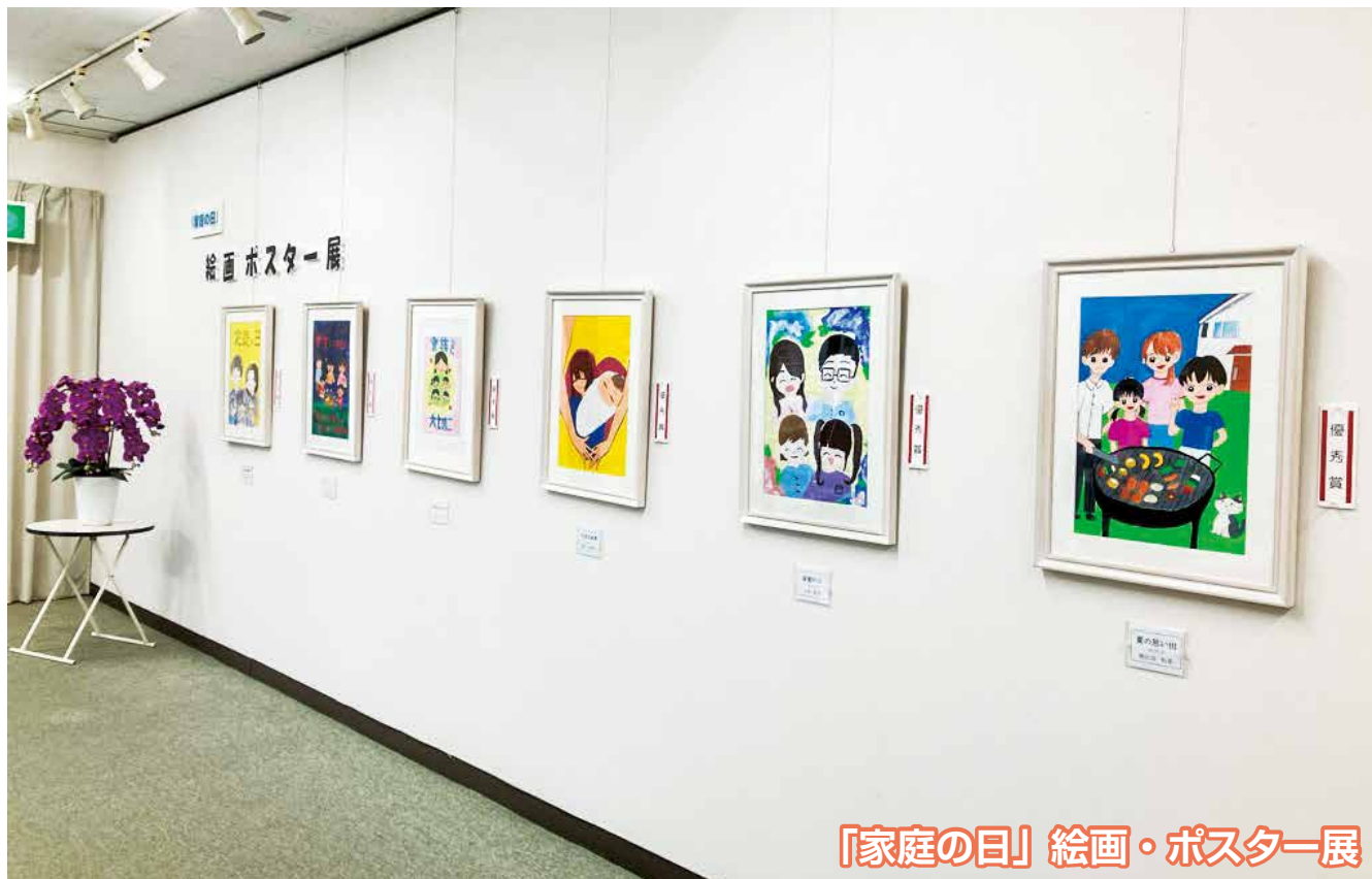
「家庭の日」絵画・ポスター展