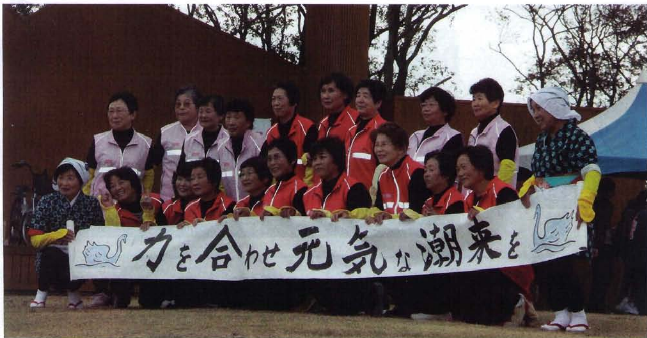
健康フェスティバルの1コマ