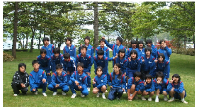
日光レークサイドホテルにて(左1組 右2組)